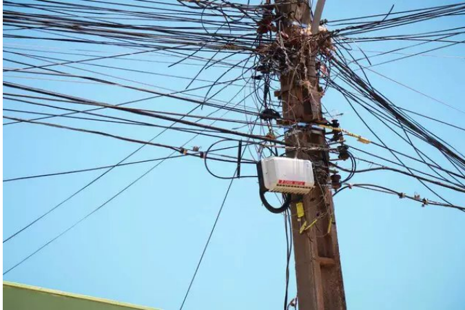
Campo Grande - MS - 2021