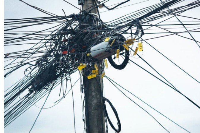
Brasília - DF - 2022