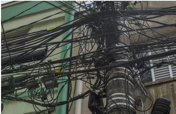
São Paulo - SP - 2019